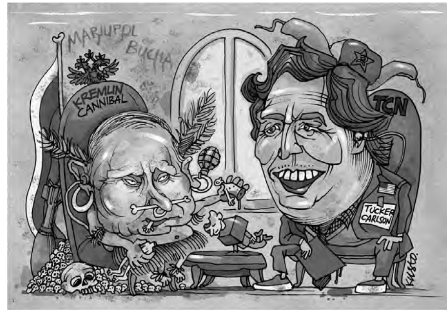
Інтерв'ю з канібалом.