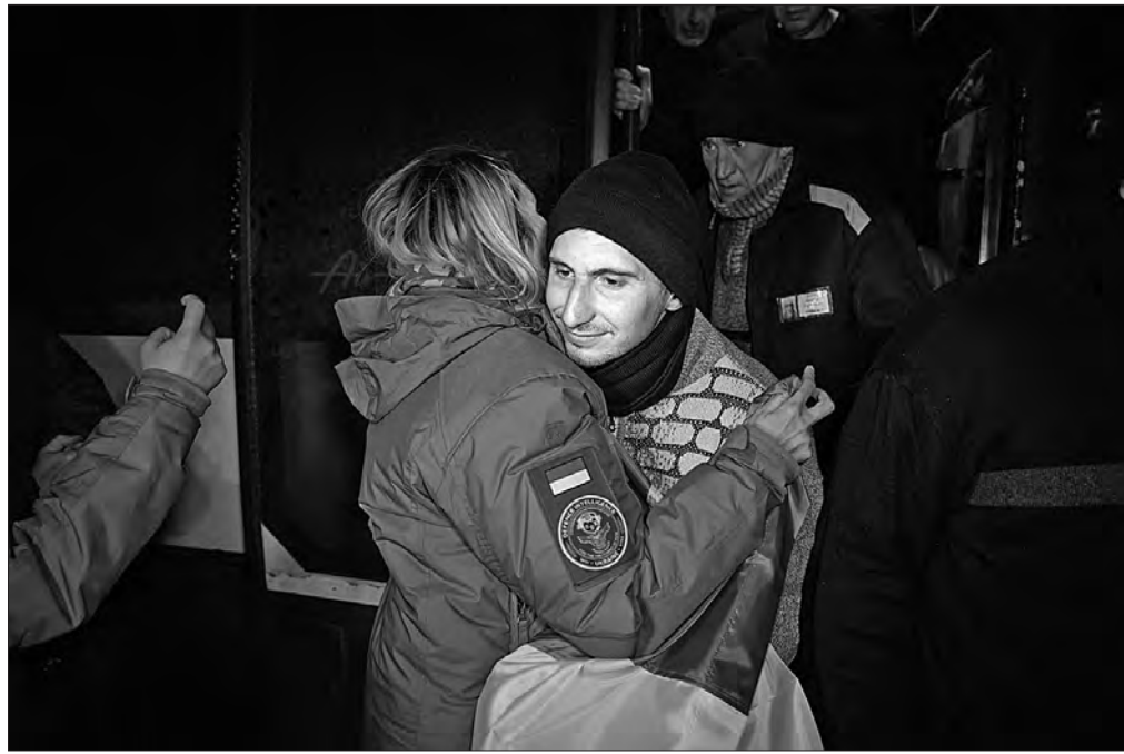
ПОЧАТОК НА 1-Й СТОР.

Подію прокоментував у телеграм-каналі і Президент Володимир Зеленський. «Ще 100 українців удома, в Україні. Нацгвардія, прикордонники, ЗСУ. Більшість — захисники Маріуполя. Усі — наші, усі — знову на рідній землі. Працюємо щодо кожного й кожної та не зупинимося, поки всіх не повернемо! Наша команда, яка займається обмінами, — дякую за потрібний країні результат!» — зазначив він. Глава держави додав, що «завжди пам'ятаємо про наших у полоні — про кожного й кожну. Усіх маємо звільнити».